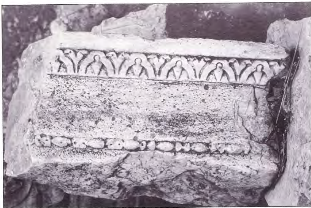
LÁMINA VII. Fragmento de arquitrabe del templo.

salvedad, creemos que mientras que no se demuestre lo contrario, no existe inconveniente alguno que impida considerar la edificación de este templo en época flavia, aunque inspirado en un modelo y dotado de una decoración arquitectónica con un marcado sabor augústeo 29 , detalles que bajo ningún concepto cabe atribuir a la casualidad, sino que denotan una elección cuyo alcance está aún por aclarar 30 .